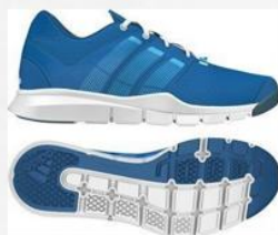
Zapatillas Training NO LISAS (Recomendación: Tonos Azules)