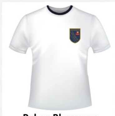
Polera Blanca con Cuello Redondo Azul y Logo del Colegio