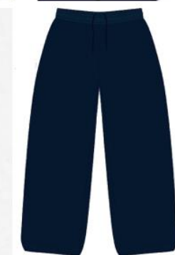
Buzo Institucional CODEMA